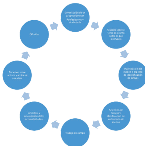
Figura 4. El ciclo del mapeo. (Elaboración propia).

Antes de empezar a identificar los activos para la salud hay que decidir quién va a formar parte del equipo de trabajo de campo, cuándo, dónde y cómo se va a recoger la información, qué recursos serán necesarios y cómo se va a monitorizar el proceso. La comunidad educativa tiene un papel central para la identificación y el mapeo de activos. Las personas que la conforman señalan los elementos que generan bienestar a nivel individual, grupal o social. Para esta tarea recomendamos seguir un ciclo parecido al que se sugiere en la guía de Salud comunitaria basada en activos (Hernán García et al. , s. f.).